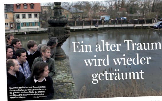
FÄHRE Der Bürgerverein Mitte wünscht sich eine Verbindung zwischen Mühwörth und Villa Concordia. Stadtplan aus Deggendorf haben fünf Konzepte erstellt und berechnet. Jetzt müssen Träger und Betreiber gefunden werden.

Bamberg Die ersten Pläne auf kleinstem Wege vom Mühlwörth zum alten Ufer der Regnitz sind im Jahr 1907 in die Welt gekommen. In den Jahren des letzten Jahrhunderts hat sich die Idee der Fährverbindung über den Fluss wieder in Bamberg gerettet. Von Neuplanung und der Realisierung war es ein langer Weg. In der Mitte des 19. Jahrhunderts hat sich ein Projekt der Villa Concordia für eine Verbindung zwischen Mühwörth und Villa Concordia entwickelt. Das Projekt wurde in den 1850er Jahren von der Stadt Bamberg initiiert, wurde aber nie verwirklicht. Die Idee wurde in den 1980er Jahren wieder aufgegriffen und ist heute ein zentrales Thema der Landesgartenschau Bamberg 2015.