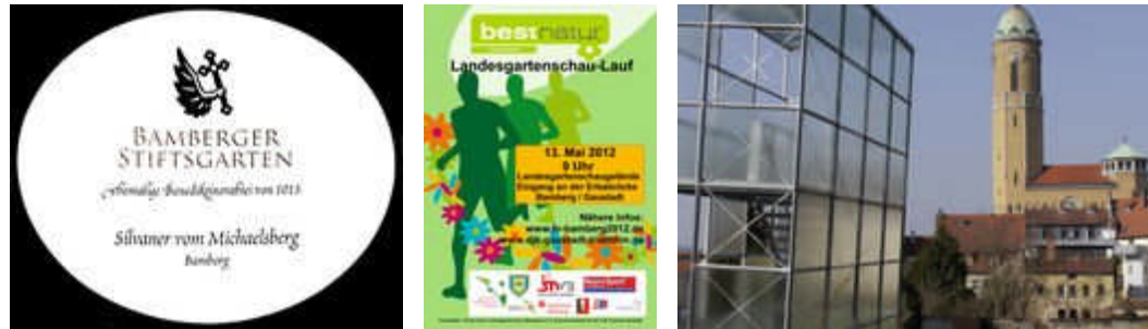
Der Wein vom neuen Weinberg Landesgartenschau-Lauf Aussichtsplattform in der Gärtnerstadt

Wann was und wo der Förderverein alles organisiert lesen Sie im "Jahresprogramm 2012" - hier per " Klick ". Zudem werden Sie per Mail zeitnah auf die Aktivitäten hingewiesen. Herzlich willkommen.