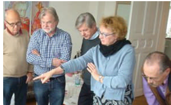
Stadtgalerie Villa Dessauer Ausstellungsimpression "Kunstgruppe"